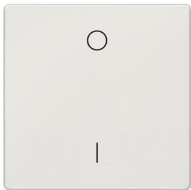
DELTA style titanweiß Wippe mit Symbol I/O 68x68mm