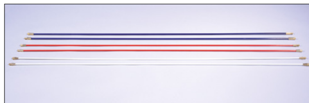
Oversikt over stenger.