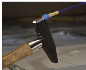
Magneten kan løfte metalleder med vekt opp til 2,5 kg.