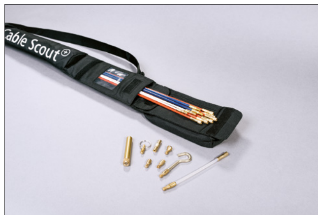
Alle deler lagres ryddig og enkelt med Cable Scout+ Deluxe sett.