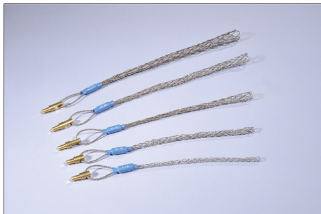
Trekkstrømper leveres i fem forskjellige størrelser for å passe et stort spekter av kabeldiametre.