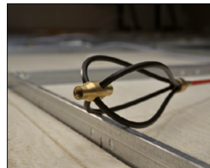
Vispen gjør at stengene glir lett over hindringer.