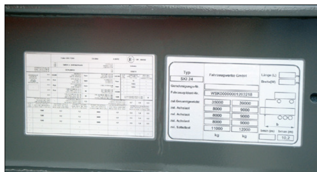
Typeskilt med beskyttelseslaminat.