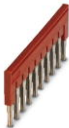
Steckbrücke, Länge: 23 mm, Breite: 60,3 mm, Polzahl: 10, Farbe: rot

Bitte beachten Sie, dass die hier angegebenen Daten dem Online-Katalog entnommen sind. Die vollständigen Informationen und Daten entnehmen Sie bitte der Anwenderdokumentation. Es gelten die Allgemeinen Nutzungsbedingungen für Internet-Downloads. ( http://phoenixcontact.de/download )