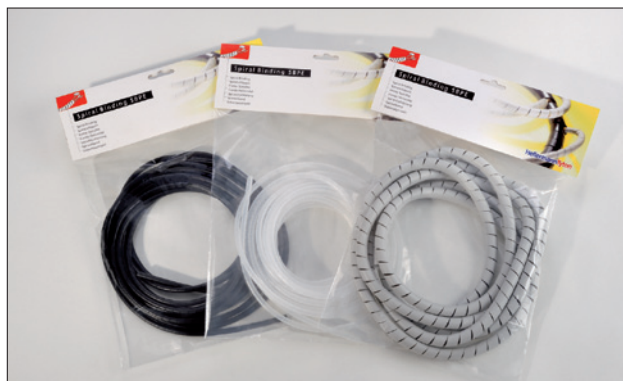
SBPE spiraalslang is ook leverbaar in 5 meter lengten.

Spiraalslang vervaardigd uit vlamvertragend polyethyleen kunt u vinden in de catalogus Engineered Solutions.