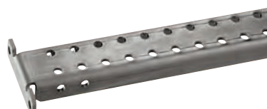
0 347 43