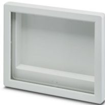
显示屏外壳，15"，浅灰色，中央窗口，前部水平，包括两个半壳体及螺钉

请注意，本PDF文档中所示数据均生成自在线目录。完整数据请见用户文档。我们的一般下载使用条款已生效。