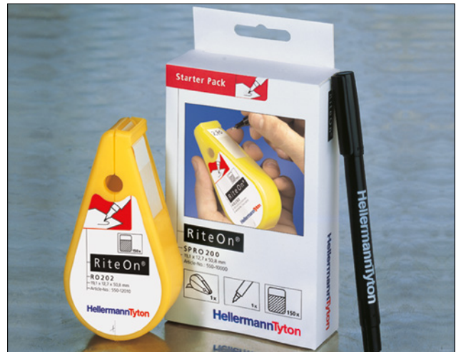
El pack de inicio RiteOn le ayudará a comenzar de inmediato.