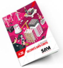
Sécurité anti-chute 2020