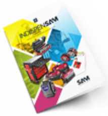
Les outils Indispensables SAM 2021

Découvrez tous nos produits dans nos catalogues en ligne