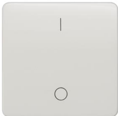
DELTA profil titanweiß Wippe mit Symbol I/O 65x65mm