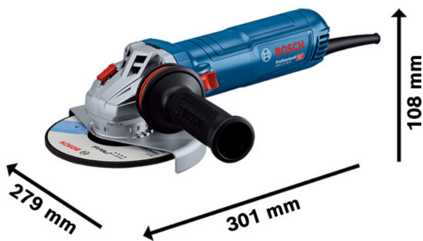
GWS 12-150 P