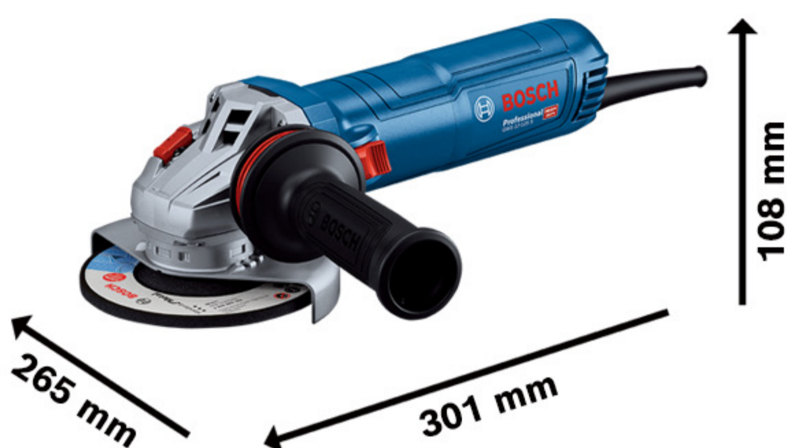
GWS 12-150 S