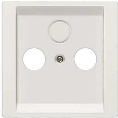
DELTA style titanweiß Abdeckplatte TV/RF/SAT,3-Loch 68x68mm