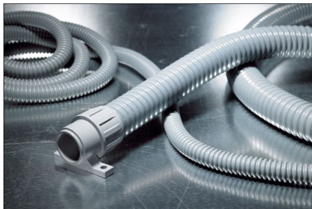
FlexiGuard FG con racor FG-UH.