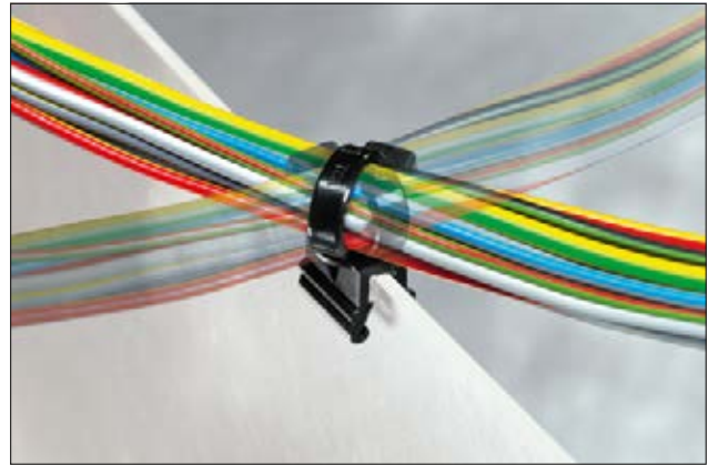
Lanière pour bord de tôle* en application et orientable à 90°.