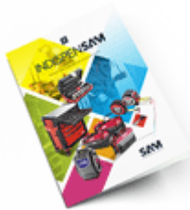
Les outils Indispensables 2021

Découvrez tous nos produits dans nos catalogues en ligne