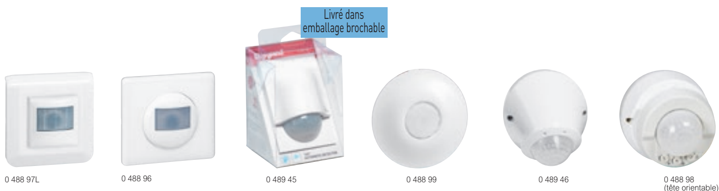
Tableau de choix p. 962 et catalogue en ligne

détecteurs de mouvement ECO 1 pour lieux de passage sans luminosité naturelle