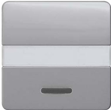
DELTA profil silber Wippe mit Schriftfeld und Fenster 65x65mm