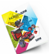
Les outils Indispensables SAM 2021

Découvrez tous nos produits dans nos catalogues en ligne