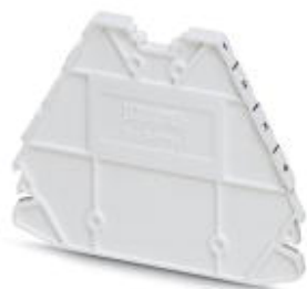
Flasque d'extrémité, Longueur: 63,6 mm, Largeur: 2,2 mm, Hauteur: 48,9 mm, Coloris: blanc

Remarque : les données indiquées ici sont tirées du catalogue en ligne. Vous trouverez toutes les informations et données dans la documentation utilisateur. Les conditions générales d'utilisation pour les téléchargements sur Internet sont applicables. ( http://phoenixcontact.fr/download )