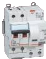
4 111 65