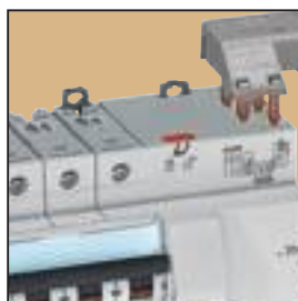
4 112 01 + 4 052 00

Caractéristiques techniques p. 544 Performance des différentiels p. 548