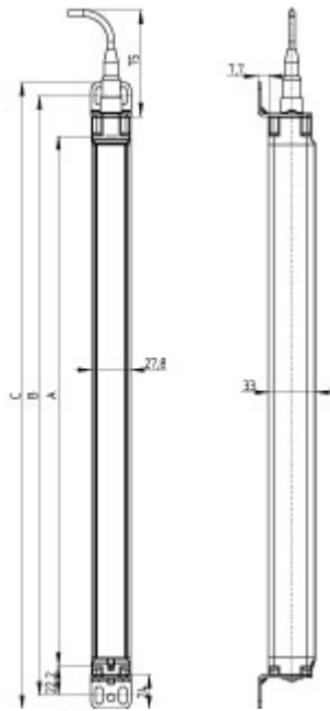
Desenho dimensional (componente básico)