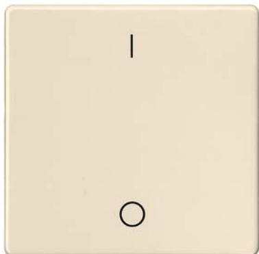
DELTA i-system elektroweiß Wippe mit Symbol I/O 55x55mm