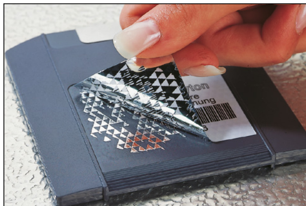
Un'identificazione sicura e antimanomissione dei cespiti.