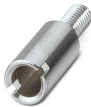
测试插头插片，颜色: 银色

请注意，本PDF文档中所示数据均生成自在线目录。完整数据请见用户文档。我们的一般下载使用条款已生效。