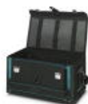
工具ケース、本体のみ、ロック付き、工具固定用ラバーストラップ付き