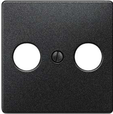
DELTA i-system carbonmetallic Abdeckplatte TV/RF/SAT , 2-Loch 55x55mm