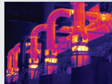
Mise au point MultiSharp™