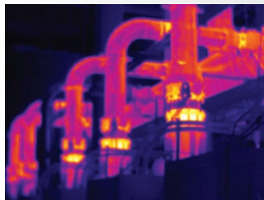
Mise au point manuelle

Une mise au point parfaite pour chaque objet. De près comme de loin. Mise au point MultiSharp™.