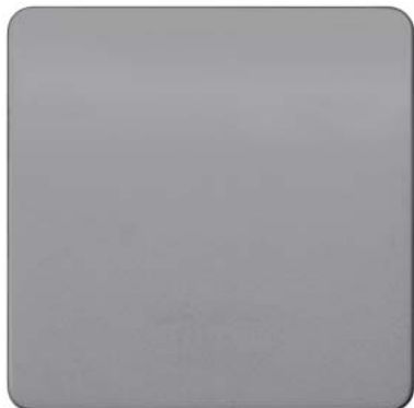
DELTA profil titanweiß Wippe neutral 65x65mm