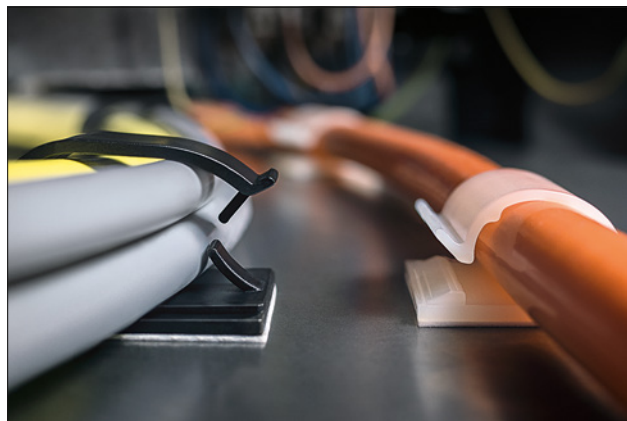
Embases adhésives de la série RB, en application.