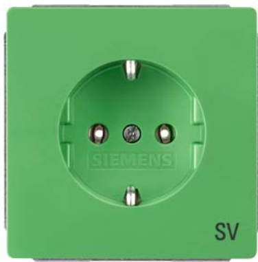
DELTA style grün SCHUKO mit Bedruckung "SV" 68x68mm 10/16A 250V