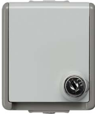
DELTA fläche IP44 AP SCHUKO 1-fach abschließbar und Klappdeckel 10/16A 250V