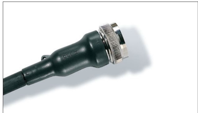
150-serie vormstuk om een connector.