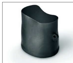
150-serie bij uitlevering.