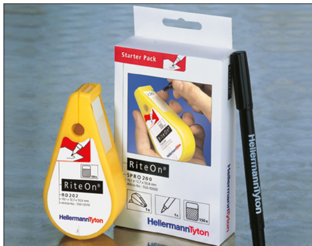
Med RiteOn startpakke har du det du trenger til merkejobben.