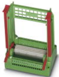
プラグインカード端子台, 定格電流: 4 A, 極数: 48, ピッチ: 5.08 mm, 接続方式: ネジ接続, 色: 緑

このPDF文書に表示されているデータはフェニックス・コンタクトのオンラインカタログから作成したものです。全データはユーザーマニュアルに記載されています。ダウンロードの規定は有効です ( http://phoenixcontact.jp/download )