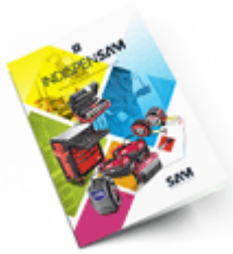
Les outils Indispensables 2021

Découvrez tous nos produits dans nos catalogues en ligne