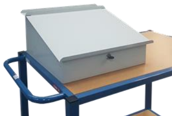
Pupitre à poser avec écriture verrouillable – 882 006 039