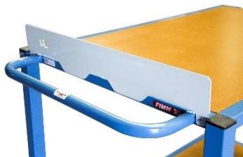
Protection des mains – 882 009 481

Préserve les mains de tout risque d'écrasement ou cisaillement lors de la manutention de pièces à monter. Vendu à l'unité.