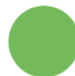
RAL SPÉCIFIQUE Sur cotation