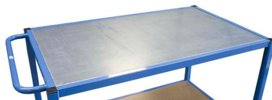
Plateau tôle galva épaisseur 25/10e