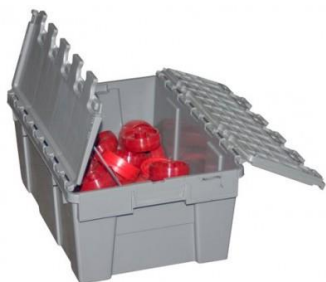
Bac plastique avec couvercle – 802006768