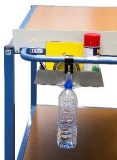
Panier en tôle et porte-bouteille intégré – 882 009 529

Boîte à outils et porte-bouteille intégré. Permet à l'opérateur de transporter des accessoires dans une boîte en tôle de dimensions : 280×80×70mm et de tenir une bouteille d'eau de 25 cl à 1,5L.