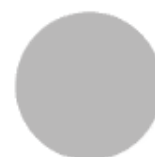
GRIS clair 7035