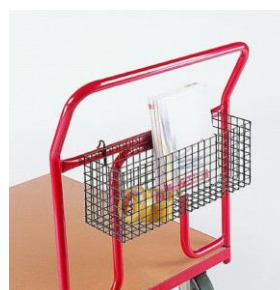
Panier à fil – 802 000 002