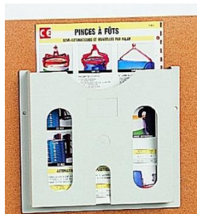
Porte-documents plastique – 802 000 001