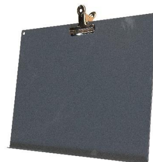
Porte-documents A3 paysage – 802 000 010