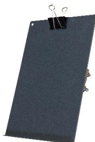
Porte-documents A4 debout – 802 000 012

Compatibilité : Pupitres, modèles avec blocs porte et 4 tiroirs