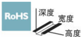
图示型号为 FLKM-D37 SUB/S

VARIOFACE模块，带螺钉接线和D-SUB针脚排，可安装在NS 35/7.5或NS 32导轨上，25位