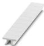
Repérage ZB, à commander : par bandes, blanc, impression selon les indications du client, type de montage: encliquetage dans la rainure de repérage élevée, pour bloc de jonction au pas de : 5,2 mm, surface utile: 5,15 x 10,5 mm

Repérage ZB - ZB 5,LGS:FORTL.ZAHLEN - 1050017