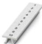
Repérage ZB, blanc, impression transversale: numérotation continue 1 ... 10, 11 ... 20, etc. jusqu'à 491 ... 500, type de montage: encliquetage dans la rainure de repérage élevée, pour bloc de jonction au pas de : 5,2 mm, surface utile: 5,15 x 10,5 mm

Repérage ZB - ZB 5,QR:FORTL.ZAHLEN - 1050020