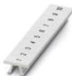
Repérage ZB, Rubans, blanc, repéré, impression longitudinale: numérotation continue 1 ... 10, 11 ... 20, etc. jusqu'à 491 ... 500, type de montage: encliquetage dans la rainure de repérage élevée, pour bloc de jonction au pas de : 5,2 mm, surface utile: 5,15 x 10,5 mm

Repérage ZB - ZB 5,LGS:FORTL.ZAHLEN - 1050017