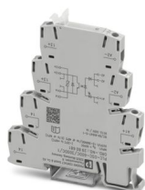
PLC-INTERFACE, integriertes Solid-State-Relais, mit Schraubanschluss, zur Montage auf Tragschiene NS 35/7,5, Eingang: 60 V DC, Ausgang: 12-300 V DC/1 A

Bitte beachten Sie, dass die in diesem PDF-Dokument angezeigten Daten aus unserem Online-Katalog generiert wurden. Bitte finden Sie die vollständigen Daten in der Benutzer-Dokumentation. Es gelten unsere Allgemeinen Nutzungsbedingungen für Downloads.