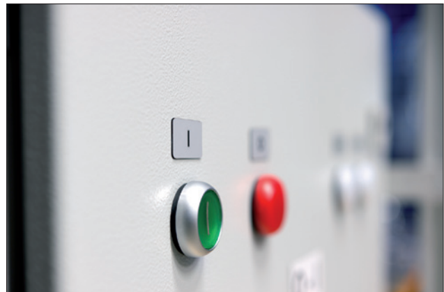
Paneelplaatjes, een uitstekend alternatief voor gegraveerde plaatjes.

Opdrukken van labels kunnen eenvoudig worden ontworpen middels TagPrint Pro.