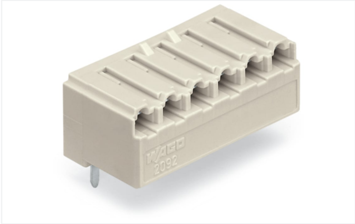
Couleur: ■ gris clair