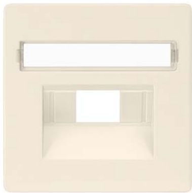
DELTA i-system elektroweiß Abdeckung UAE-Kat.3, 1-und 2f, Schriftfeld