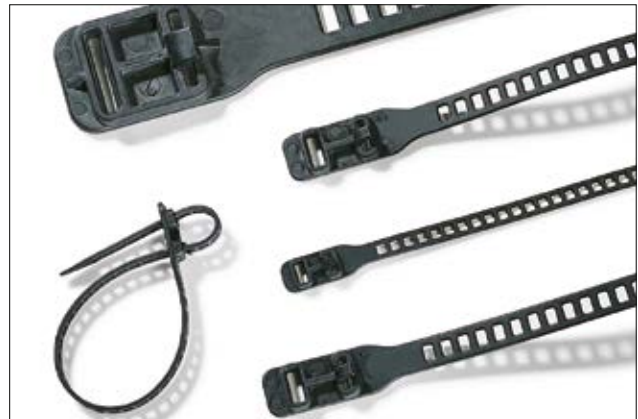
Elastisch und vielseitig einsetzbar: die SRT- und SOFTFIX-Kabelbinder.