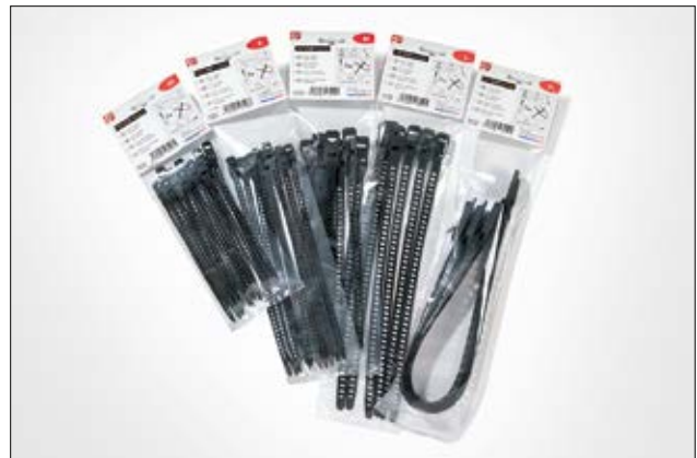
Die SOFTFIX-Familie ist in praktischen Kleinverpackungen erhältlich.