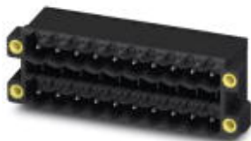
図はコンタクト20点を接続する10極仕様

ソケット, 定格電流: 12 A, 定格電圧 ( III/2 ) : 400 V, 極数: 12, ピッチ: 5.08 mm, 色: 黒, コネクタ表面: すす, 取付け方法: テープ梱包型SMD/THT/THRコンポーネント