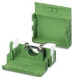
Carcasa de cables, paso: 0 mm, número de polos: 6, media a: 30 mm, color: verde

Tenga en cuenta que los datos indicados aquí proceden del catálogo en línea. Los datos completos se encuentran en la documentación del usuario. Son válidas las condiciones generales de uso de las descargas por Internet. ( http://phoenixcontact.es/download )