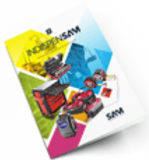
Les outils Indispensables 2021