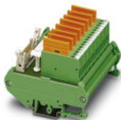
ヒューズモジュール ( Delta V制御システムのアナログ出力カード用 )

このPDF文書に表示されているデータはフエニックス・コンタクトのオンラインカタログから作成したものです。全データはユーザーマニュアルに記載されています。ダウンロードの規定は有効です ( http://phoenixcontact.jp/download )