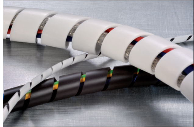
Spiraalslang SBPEFR is beschikbaar in meerdere diameters, in zwart en wit.

Spiraalslang vervaardigd uit standaard polyethyleen kunt u vinden in de Algemene catalogus.