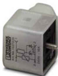
阀连接器, 3-芯, A 阀插头, 与 1个LED, 与.....连接 压敏电阻, 螺钉连接, 电缆密封 Pg9, 电缆外径 6 mm ... 8 mm

Please be informed that the data shown in this PDF Document is generated from our Online Catalog. Please find the complete data in the user's documentation. Our General Terms of Use for Downloads are valid ( http://download.phoenixcontact.com )