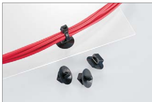
Embases SFC3, en application.