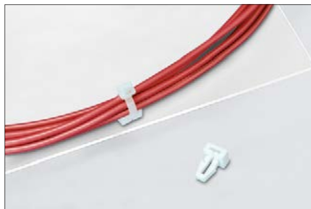
Embase TM1SF, en application.